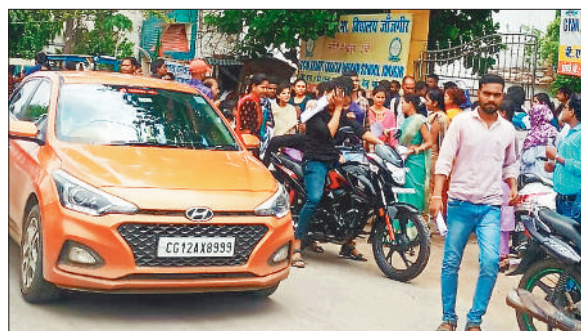
परीक्षा देकर बाहर निकलते अभ्यर्थी।

गौरतलब है कि छत्तीसगढ़ व्यवसायिक परीक्षा मंडल के द्वारा रविवार 23 जून को शिक्षक पात्रता परीक्षा टेस्ट का आयोजन किया गया। परीक्षा में शामिल होने के लिए करीब 22 हजार 700 सौ 85 अभ्यर्थियों ने अपना आवेदन आनलाइन जमा किए थे। पहली पाली की परीक्षा जिनमें प्राथमिक स्कूल के लिए परीक्षा का आयोजन पहली पाली सुबह 9 बजकर 30 मिनट से लेकर दोपहर 12 बजकर 15 मिनट तक आयोजित किया गया। जिसमें शामिल होने के लिए 9 हजार 515 अभ्यर्थियों ने अपना आवेदन आनलाइन जमा किए थे। इसी प्रकार दूसरी पाली की परीक्षा मिडिल स्कूल के लिए दोपहर 2 बजे से लेकर शाम 4 बजकर 45 मिनट तक के लिए आयोजित किया गया। जिसमें शामिल होने के लिए 13 हजार 270 अभ्यर्थियों ने आनलाइन आवेदन जमा किए थे। पहली एवं