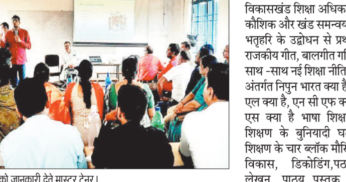
प्रशिक्षण में शिक्षकों को जानकारी देते मास्टर ट्रेनर।