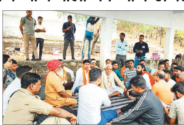
बैठक में शामिल अफसर एवं ग्रामीण।

अकलतरा स्थित पर्यटन स्थल दल्हा पहाड़ में आने जाने वालों का नाम अब रजिस्टर में संधारित किया जाएगा। इस तरह का निर्णय मंदिर परिसर में तोडफोड़ की हुई घटना को लेकर लिया गया है। साथ ही सीसी टीवी कैमरे भी लगाए जाएंगे। गौरतलब है कि दल्हा पहाड़ की चोटी पर बजरंग दल के द्वारा स्थापित बजरंगबली की प्रतिमा एवं शिवलिंग सहित धार्मिक स्थल पर 18 जून को असामाजिक तत्वों के द्वारा तोडफोड़ की घटना से आक्रोशित क्षेत्र वासियों द्वारा आरोपियों की गिरफ्तारी की मांग को लेकर 19 जून को थाने का घेराव कर दिया गया था। घटना की