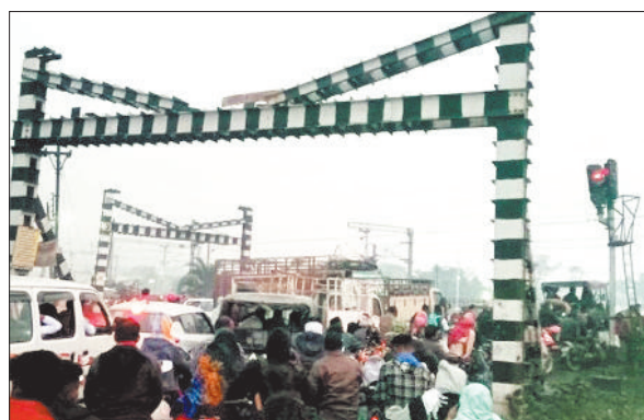
नेला रेलवे फाटक में लगी वाहनों की कतार।

गौरतलब है कि अभिवाजित जांजगीर चांम्पा एवं सक्ती जिले के अंतर्गत आधा दर्जन से भी अधिक रेलवे स्टेशन का संचालन किया जा रहा है। जहां से प्रतिदिन हजारों की तादाद में लोग ट्रेन पकड़ने के लिए आते हैं। इन रेलवे स्टेशन के अंतर्गत बड़ी संख्या में रेलवे फाटक एवं समपार का संचालन रेलवे बोर्ड वही भारतीय रेल मंडल के अंतर्गत किया जा रहा है। नियमों के तहत सभी रेलवे फाटक एवं समपार को बंद करके उसके स्थान पर ओवर ब्रिज का निर्माण कार्य कराया जाना है। ताकि आम लोगों के साथ बड़े एवं छोटे वाहन चालकों को रेलवे फाटक खुलने के लिए घंटों इंतजार ना करना पड़े। वही ज्यादातर स्थानों