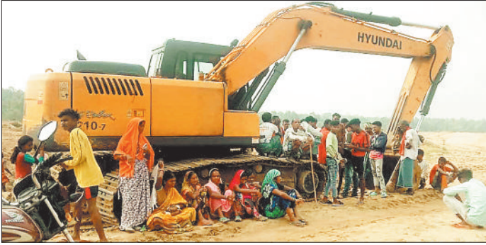
नदी में चैन माउंटेन मशीन का विरोध करते ग्रामीणों।

बारिश का सीजन शुरू होते ही जिले के सभी रेत घाटों को खनिज विभाग ने बंद कर दिया है बावजूद इसके रेत तस्करो के हौसले बुलंद हैं व किसी भी नदी नाले को