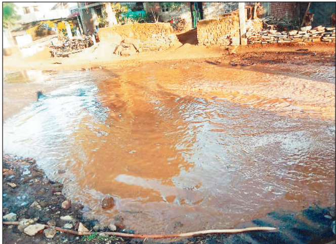
सड़क में बना पोखरनुमा गड्ढा।

हरिभूमि न्यूज ►► तनौद देवरी मोड़ से तनौद भुईगांव पहुंच मार्ग इन दिनों पोखर में तब्दील हो गया है। पहली ही बारिश में मार्ग में जगह-जगह बने बड़े-बड़े गड्ढे में पानी भरने से दो पहिया, चार पहिया वाहन चालकों के साथ क्षेत्र के लोगों को आवागमन में परेशानी हो रही है। देवरी मोड़ से तनौद भुईगांव की ओर जाने वाली सड़क की स्थिति खस्ताहाल हो गया है। बरखात के दिनों राहगीर कीचड़ और गर्मी के दिनों धूल से परेशान होते हैं वहीं बारिश के मौसम में अब मार्ग में