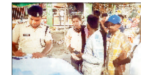
कार्रवाई करते यातायात के जवान।

जात हो कि जिले में सड़क दुर्घटना में कमी लाने के लिए यातायात पुलिस जांजगीर द्वारा यातायात नियमों का उल्लंघन करने वाले वाहन चालकों के विरुद्ध मोटर वाहन अधिनियम के तहत लगातार कार्यवाही की जा रही है। इसी क्रम में 22 जून को विशेष अभियान चलाया गया जिसमें मोटर वाहन अधिनियम के तहत पार्किंग में वाहन खड़ी करना, नम्बर प्लेट अस्पष्ट होना, वाहन में रिफ्लेक्टर ग्लास नहीं होना, बिना हेलमेट के