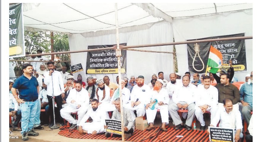
जांजगीर-चांपा। आरंग में हुए मौब लीचिंग के विरोध में मुस्लिम जमात द्वारा रविवार 23 जून को जिला मुख्यालय जांजगीर के कचहरी चौक में धरना प्रदर्शन किया गया। जिला मुस्लिम कौमी एकता मंच के द्वारा किए गए प्रदर्शन में समाज के लोग बड़ी संख्या में शामिल हुए।