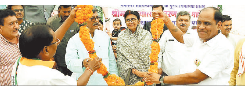
नेता प्रतिपक्ष व सांसद का महामाला से स्वागत करते कार्यकर्ता।