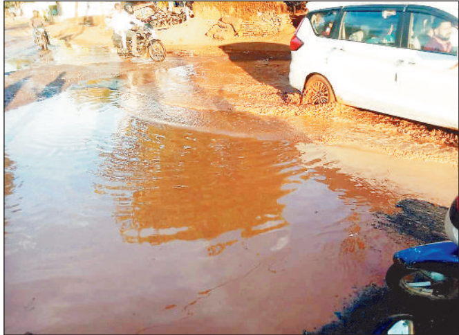
मार्ग में बने गड्ढों से होकर गुजरते वाहन चालक।