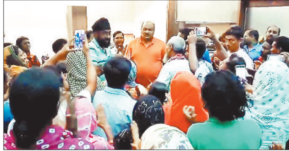
पूर्व राज्य मंत्री से चर्चा करते बस्तीवासी।