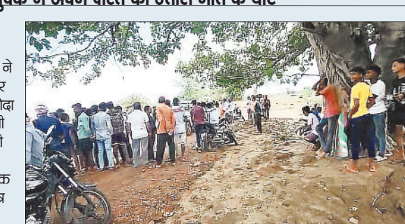
मौके पर लगी ग्रामीणों की भीड़।